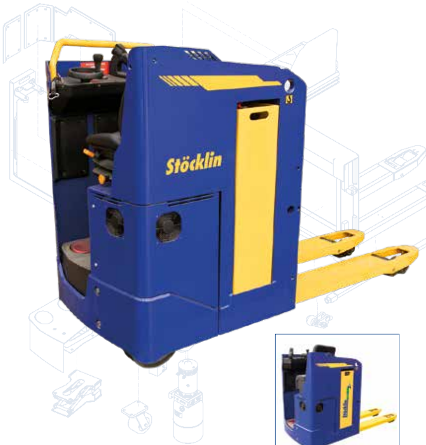
Auch mit Standsitz erhältlich