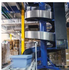
Vertikalfördersysteme Vertical Conveyor