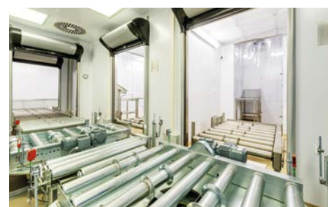
Palettenfördersysteme Pallet Conveyor