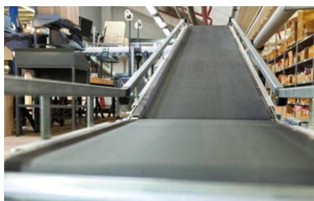
Gurtförderbänder Belt Conveyor