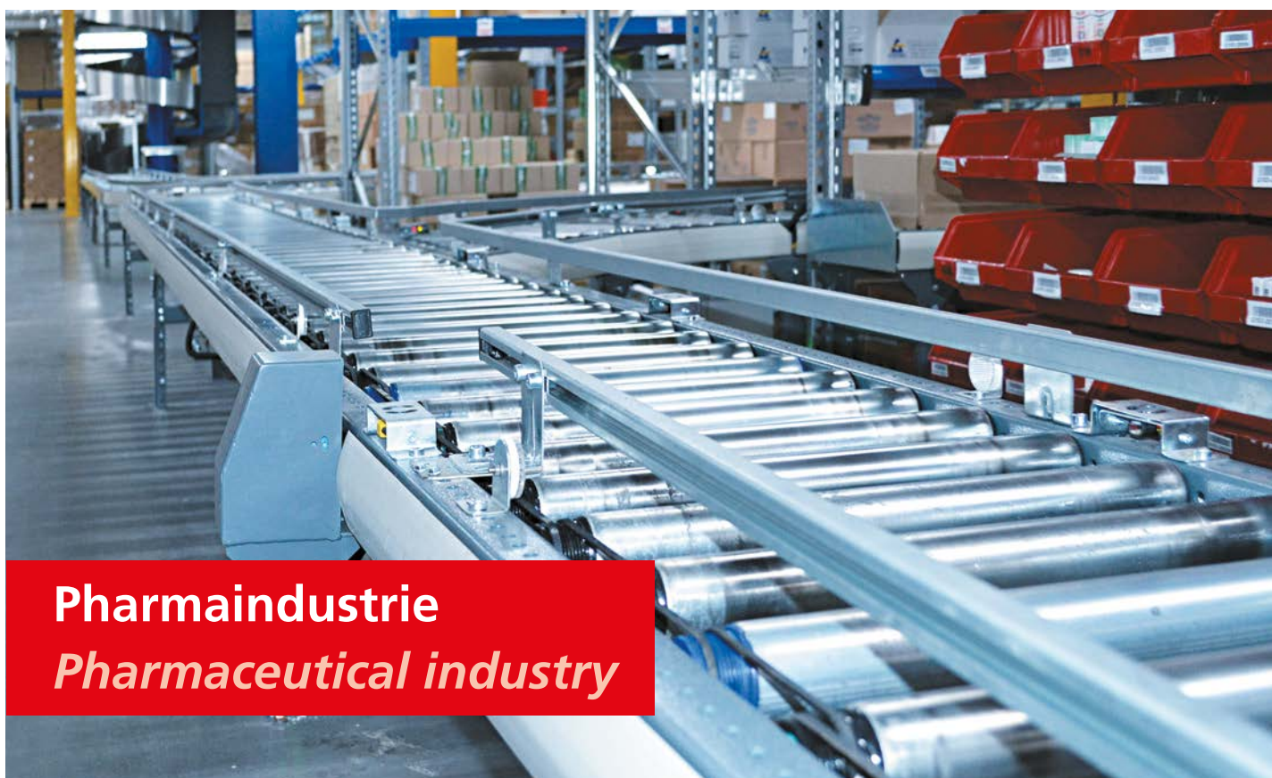
Pharmaindustrie Pharmaceutical industry