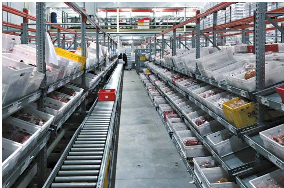
Lebensmittelindustrie Food industry