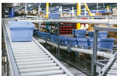
Nicht antriebener Rollenförderer Non-driven Conveyor