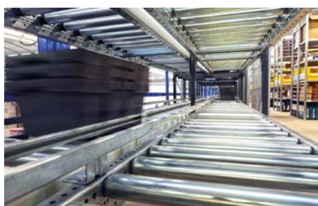
Antriebener Rollenförderer Driven Conveyor

META-ILS represents the combination of META warehouse technology and innovative logistics/conveyor technology solutions (ILS = Innovative Logistic Solutions). Through holistic warehouse planning including preceding analysis, consultation and simulation, we generate a sustainable competitive advantage for our customers.