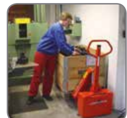
Patentierter Zylinder-Konstruktion ergibt eine niedrige Bauhöhe.

Gerne bieten wir Ihnen auch kundenspezifische Lösungen an. Besuchen Sie auch www.logitrans.com