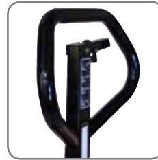
Die ergonomisch geformte Deichsel sorgt für einen entspannten Griff.