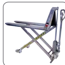
Manuell, elektrisch rostfrei und explosionsgeschützt.