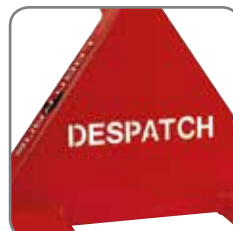
Die Deichsel kann mit Name/Abteilung gekennzeichnet werden.