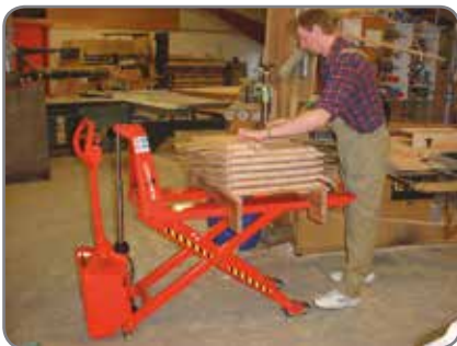
Zubehör: Fernbedienung, Positionskontrolle, Bremse, Ladegerät (extern oder eingebaut).