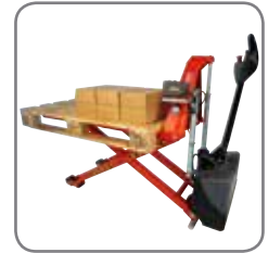
Die Positionskontrolle (Zubehör) hält die Arbeitshöhe konstant.