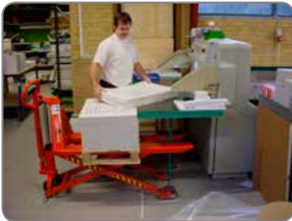
Der manuelle Scherenhubwagen hat sehr niedrige Pumpkraft, Fußschutz und Neutralstellung.

* Tragkraft reduziert sich von 1500 auf 1000 kg ab der Hubhöhe von 470 mm.