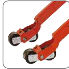
Die Tandem-Gabelrollen haben eine Bremsicherung und schonen den Boden.